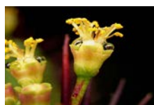
цветок с нектаром