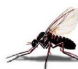
взрослая мошка (самец)