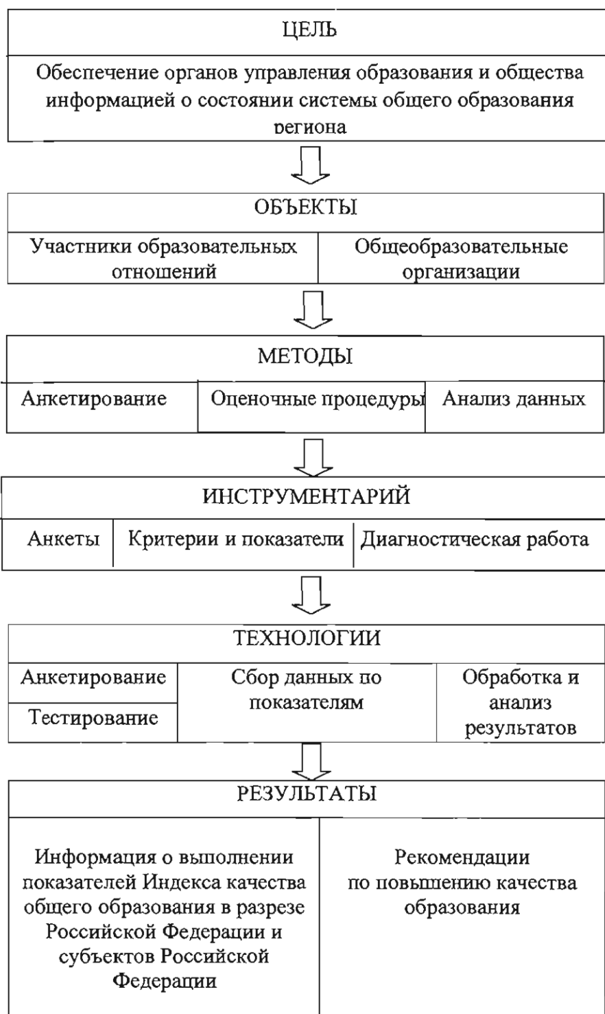
Рисунок 1 -- Модель проведения мониторинга эффективности деятельности общеобразовательных организаций

В ходе формирования Индекса качества общего образования осуществляется сбор данных следующих категорий: